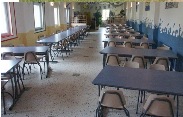
Les chambres sont composées de 1 à 5 lits.